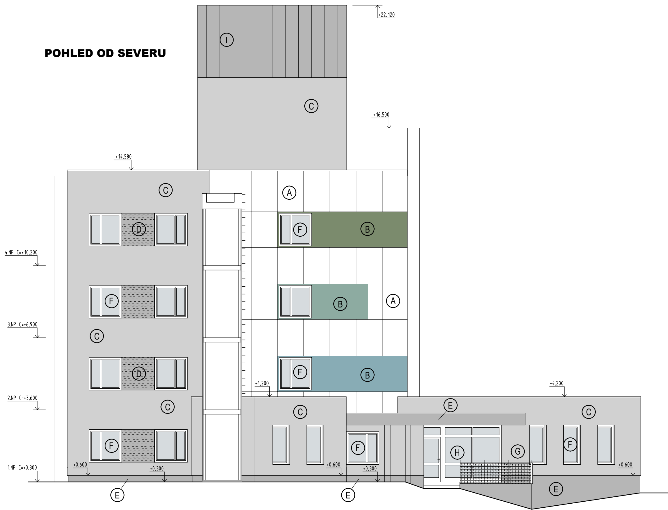
POHLED OD SEVERU